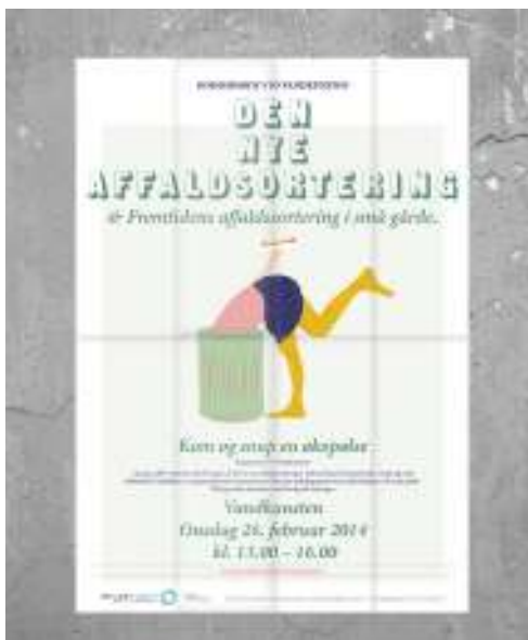
Plakat fra borgerarrangement på Vandkunsten Februar 2014

Miljøpunkt Indre By - Christianshavn Rådhuspladsen 77 st. tv 1550 København